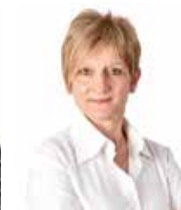
Ferrandino Siponta Infermiera