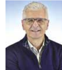
Antonio Mandelli Fotografo